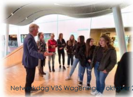
Netwerkdag VBS Wageningen | oktober 2024