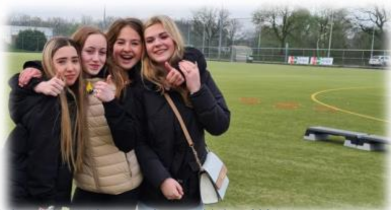
Netwerkdag VBS Wageningen oktober 2024